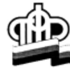
График доставки пенсий отделениями почтовой связи за праздничные дни в ноябре текущего года: