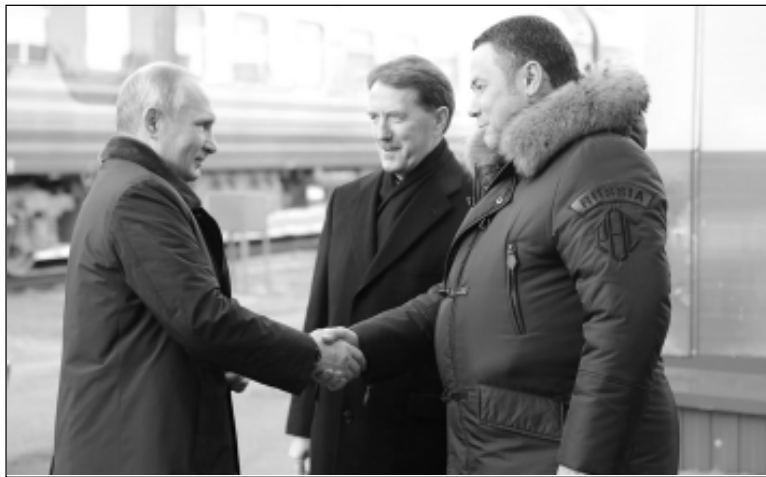
С начала года президент Владимир Путин провел уже две рабочие встречи с губернатором Игорем Руденей, и обе — на Тверской земле

Значимость мероприятия, на котором обсуждали перспективы сохранения и разви-